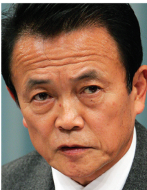
Primer Ministro Taro Aso, 68: Líder del Partido Liberal Democrático (PLD)

Los pronósticos favorecen al Partido Democrático de Japón como triunfador en la elección del 30 de agosto frente al Partido Liberal Democrático, que ha gobernado la segunda economía mundial casi totalmente durante los pasados 54 años