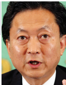
Yukio Hatoyama, 62: Líder del Partido Democrático de Japón (PDJ). Principal opositor

Economía: El gasto en estímulos ha dejado una deuda pública equivalente al 170% del PIB. Hatoyama planea transformar la economía basada en la exportación en una basada en la demanda interna. Reducirá de 18% a 11% los impuestos a las pequeñas y medianas empresas. Aso planea subir 5% el impuesto a las ventas para financiar el costo del bienestar social, luego de que la economía se recupere. Ambos prometen elevar el ingreso familiar disponible